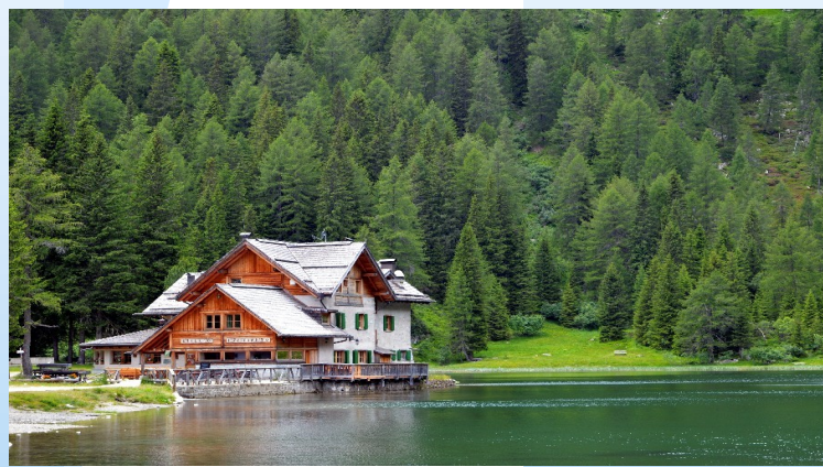
Foto Lago Nambino